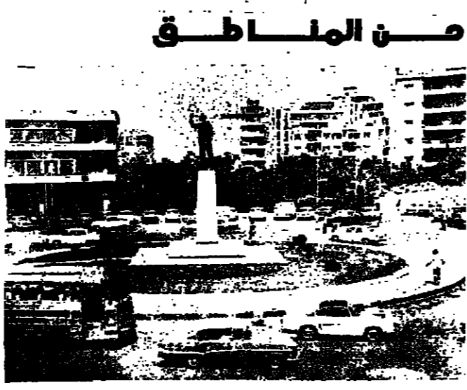
تمثال عبد الحميد كرامي

تمثال عبد الحميد كرامي عائد الى قاعدته السيد علي قاعدته قبل الأحداث